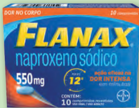
Anti-Inflamatório Flanax 550mg 10 Comprimidos