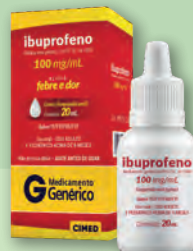
Analgésico e Antitérmico Ibuprofeno 100mg Cimed 20ml