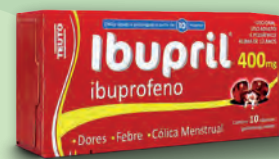
Analgésico e Antitérmico Ibupril 400mg Teuto 10 Cápsulas