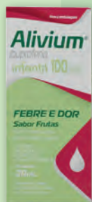
Analgésico e Antitérmico Alivium Gotas 100mg/ml 20ml