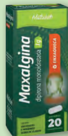
Analgésico Maxalgina 1g 20 Comprimidos