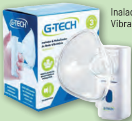
Inalador Nebulizador de Rede Vibratória G-Tech NEBMESH2

2x s/ juros de R$ 64,95 ou R$ 129,90 À VISTA