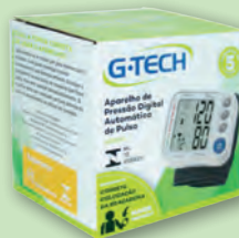
Aparelho de Pressão de Pulso Digital G-Tech GP400

3x s/ juros de R$ 63,30 ou R$ 189,90 À VISTA