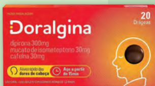
Analgésico Doralgina 20 Comprimidos