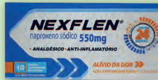
Anti-Inflamatório Nexflen 550mg 10 comprimidos