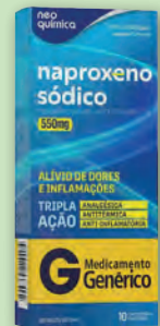
Anti-Inflamatório Naproxeno 550mg Neo Química 10 Comprimidos