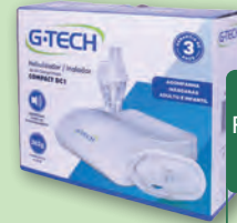
Inalador Nebulizador G-Tech Compact DC1

3x s/ juros de R$ 53,30 ou R$ 159,90 À VISTA