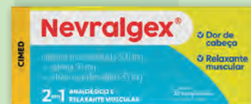
Analgésico Nevalgex 30 Comprimidos